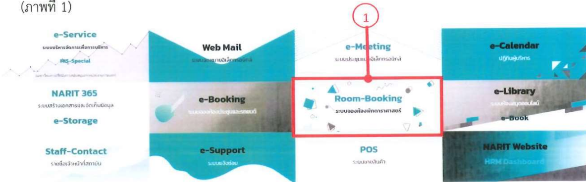
ภาพที่ 1 หน้าแรกของระบบ MIS

1. ผู้ใช้ห้องพัก เข้าระบบจองห้องพักผ่านเว็บไซต์สถาบัน ที่ https://info.narit.or.th/ ผู้ใช้งานจะเห็นเมนูการใช้งานของแต่ละระบบ MIS ให้เลือกเมนู Room-Booking ระบบจองห้องพักราคาศาสตร์ (ภาพที่ 1)