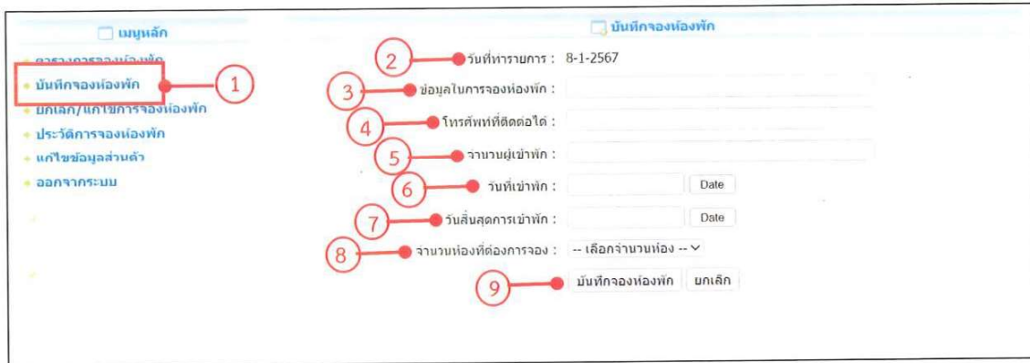
ภาพที่ 3 แบบฟอร์มการกรอกข้อมูลการจองห้องพัก

3. เมื่อตรวจสอบข้อมูลการจองในตารางการจองห้องพักเรียบร้อยแล้ว ในขั้นตอนนี้จะเป็นการเข้าสู่ระบบจองห้องพักออนไลน์ โดยให้ระบุ “ชื่อผู้ใช้” และ “รหัสผ่าน” เพื่อทำการเข้าระบบจองห้องพักออนไลน์ กดเมนูบันทึกการจองห้องพัก เพื่อเข้าไปยังหน้าจอฟอร์มการกรอกข้อมูลการจองห้องพัก (ภาพที่ 3)